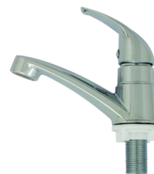
CÓD. DESCRIÇÃO 7309 TORNEIRA ABS CROMADA ALAVANCA C87