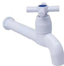
CÓD. DESCRIÇÃO 7160 TORNEIRA ABS BRANCA COZINHA PAREDE 1158