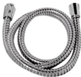
CÓD. DESCRIÇÃO 5163 ENGATE INOX 120 CM DUCHA HIGIÊNICA