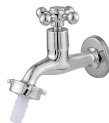
CÓD. 4516 DESCRIÇÃO TORNEIRA 1130 LUXO 1/4 METAL