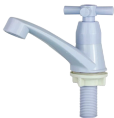
CÓD. DESCRIÇÃO 7157 TORNEIRA ABS BRANCA LAVATORIO FIXA