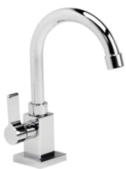
CÓD. 6186 DESCRIÇÃO TORNEIRA 1195 QUADRADA LUXO PIA MESA