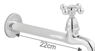
CÓD. 2194 DESCRIÇÃO TORNEIRA 1159 METAL C/ BICO C-33 22CM 2195 TORNEIRA 1159 METAL S/ BICO C-33 22CM 4385 TORNEIRA 1159 METAL C/ BICO AREJADO C-33 22CM