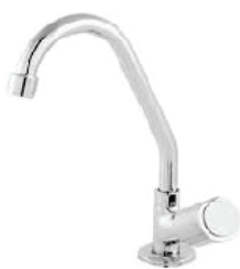
CÓD. 5779 DESCRIÇÃO TORNEIRA 1169 BM METAL PIA MESA C-40