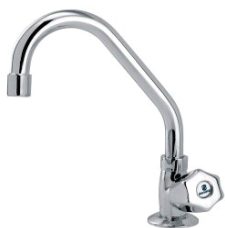
CÓD. 2199 DESCRIÇÃO TORNEIRA 1169 BM METAL PIA MESA C-50 3085 TORNEIRA 1169 LUXO BM PIA MESA C-50