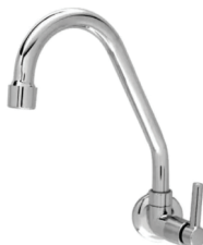
CÓD. DESCRIÇÃO 2201 TORNEIRA 1168 BM 1/4 PIA PAREDE CACHIMBO 3063 TORNEIRA 1168 LUXO BM 1/4 METAL PIA PAREDE