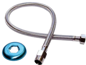
CÓD. DESCRIÇÃO 3766 ENGATE INOX 40 CM FLEXIVEL 3764 ENGATE INOX 60 CM FLEXIVEL