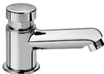
CÓD. 2601 DESCRIÇÃO TORNEIRA LAVATORIO TEMPORIZADA