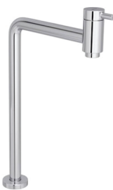
CÓD. 3016 DESCRIÇÃO TORNEIRA LINK 90° 1/4 ALTA 1199