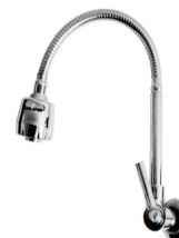
CÓD. DESCRIÇÃO 2188 TORNEIRA GOURMET METAL 1/4 PAREDE CACHIMBO