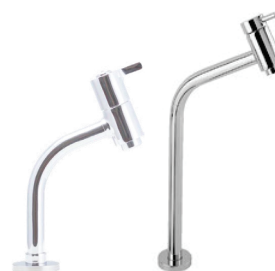
CÓD. 3015 DESCRIÇÃO TORNEIRA LINK 45° 1/4V ALTA 1198 3014 TORNEIRA LINK 45° 1/4V BAIXA 1197