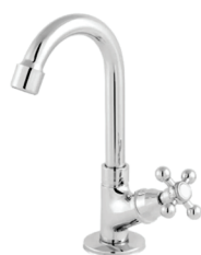
CÓD. 5182 DESCRIÇÃO TORNEIRA 1195 BM METAL LAV MESA C-33