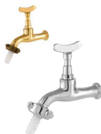
CÓD. 2191 DESCRIÇÃO TORNEIRA 1130 METAL AMARELA JARDIM 2190 TORNEIRA 1130 METAL CROMADA JARDIM