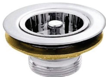
CÓD. DESCRIÇÃO 2209 VÁLVULA AMERICANA PIA METAL