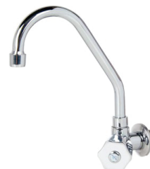
CÓD. DESCRIÇÃO 2198 TORNEIRA 1168 BM METAL PIA PAREDE C-50 3084 TORNEIRA 1168 LUXO BM PIA PAREDE C-50