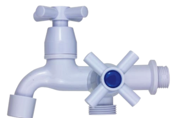
CÓD. DESCRIÇÃO 7306 TORNEIRA ABS BRANCA TANQUE MAQUINA