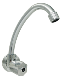
CÓD. DESCRIÇÃO 7130 TORNEIRA 1168 BM METAL PIA PAREDE C-25 TUBO ANZOL