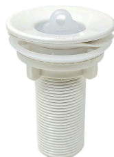
CÓD. DESCRIÇÃO 1587 VALVULA LAVATORIO ABS BRANCA V8