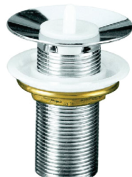
CÓD. DESCRIÇÃO 2210 VÁLVULA LAVATÓRIO METAL