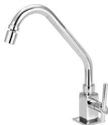
CÓD. 6187 DESCRIÇÃO TORNEIRA 1169 QUADRADA LUXO PIA MESA