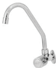
CÓD. 5778 DESCRIÇÃO TORNEIRA 1168 BM METAL PIA PAREDE C-40