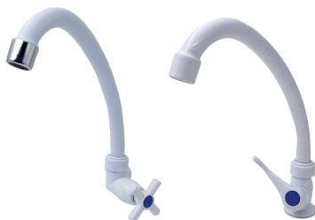
CÓD. DESCRIÇÃO 7159 TORNEIRA ABS BRANCA COZINHA PAREDE BM 7161 TORNEIRA ABS BRANCA COZINHA MESA BM