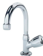
CÓD. 3083 DESCRIÇÃO TORNEIRA 1195 LUXO BM LAV. MESA C-50 ULTRA 2200 TORNEIRA 1195 BM METAL LAVATÓRIO C-50 ULTRA