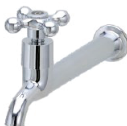
CÓD. 2192 DESCRIÇÃO TORNEIRA 1158 METAL C/ BICO C-33 18CM 2193 TORNEIRA 1158 METAL S/ BICO C-33 18CM 5014 TORNEIRA 1158 METAL C/ BICO AREJADO C-33 22CM