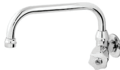
CÓD. DESCRIÇÃO 4517 TORNEIRA 1168 BICA BAIXA METAL PIA PAR. C-50