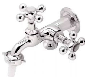
CÓD. 2208 DESCRIÇÃO TORNEIRA 1131 METAL TAN./MÁQUI. C-33