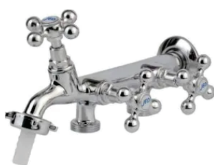
CÓD. 6465 DESCRIÇÃO TORN. 1133 C/3 SAÍDAS TANQUE/MAQUINA C-33