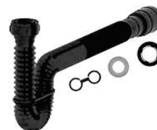
CÓD. DESCRIÇÃO 7493 SIFÃO UNIVERSAL PRETO