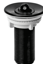
CÓD. DESCRIÇÃO 6291 VALVULA LAVATORIO PRETA ABS