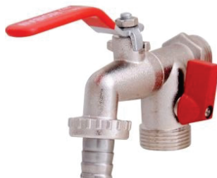
CÓD. DESCRIÇÃO 2604 TORNEIRA 1/2 ESFERA CABO VERMELHO MAQ.