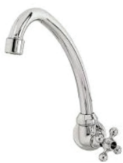
CÓD. DESCRIÇÃO 5180 TORNEIRA 1168 BM METAL PIA PAREDE C-33