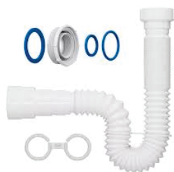
CÓD. DESCRIÇÃO 7492 SIFÃO UNIVERSAL BRANCO