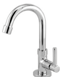
CÓD. 2203 DESCRIÇÃO TORNEIRA 1195 BM 1/4 METAL LAVA. MESA CA. 3065 TORNEIRA 1195 LUXO BM 1/4 LAV. MESA CACHIMBO