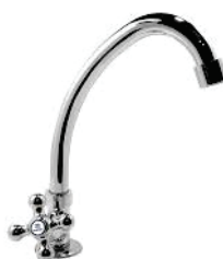
CÓD. 5181 DESCRIÇÃO TORNEIRA 1169 BM METAL PIA MESA C-33