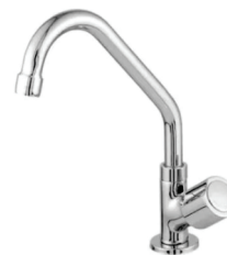
CÓD. 5779 DESCRIÇÃO TORNEIRA 1169 BM METAL PIA MESA C40