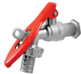
CÓD. DESCRIÇÃO 6686 TORNEIRA ESFERA CADEADO 1/2"