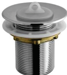
CÓD. DESCRIÇÃO 5152 VÁLVULA TANQUE METAL