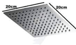
CÓD. DESCRIÇÃO 7352 DUCHA INOX QUADRADA 20 CM METAIS