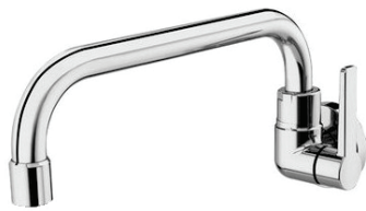
CÓD. DESCRIÇÃO 4518 TORNEIRA 1168 BICA BAIXA 1/4 METAL PIA PAR.