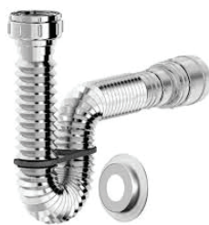
CÓD. DESCRIÇÃO 7494 SIFÃO UNIVERSAL CROMADO