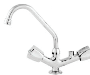
CÓD. 2706 DESCRIÇÃO TORNEIRA 1164 BM MESA C/ADAP. FILTRO C-50