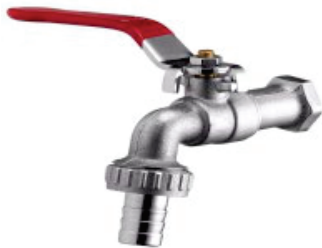
CÓD. DESCRIÇÃO 2204 TORNEIRA ESFERA 1/2 CABO VERMELHO METAL