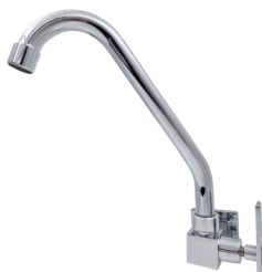
CÓD. DESCRIÇÃO 6185 TORNEIRA 1168 QUADRADA LUXO PIA PAREDE