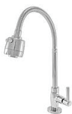
CÓD. 2189 DESCRIÇÃO TORNEIRA GOURMET METAL 1/4 MESA CACHIMBO