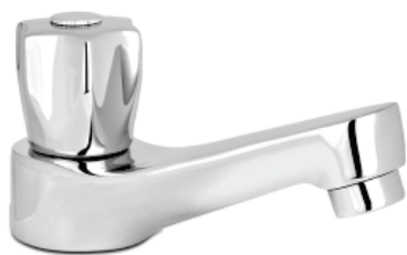
CÓD. 2197 DESCRIÇÃO TORNEIRA 1194 METAL LAVATORIO LUXO C-50