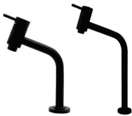
CÓD. DESCRIÇÃO 7307 TORNEIRA LINK PRETA 45o 1/4V BAIXA 7308 TORNEIRA LINK PRETA 45o 1/4V ALTA