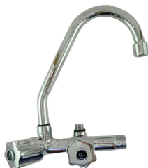
CÓD. DESCRIÇÃO 2705 TORNEI. 1155 BM PAREDE C/ADAP. FILTRO C-50