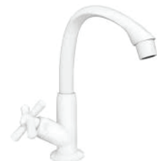
CÓD. DESCRIÇÃO 7358 TORNEIRA ABS BRANCA LAVATORIO BICA MOVEL MESA