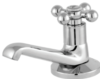
CÓD. DESCRIÇÃO 2196 TORNEIRA 1193 METAL LAVATORIO C-33