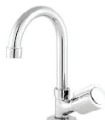
CÓD. 5780 DESCRIÇÃO TORNEIRA 1195 BM METAL LAVATORIO C-40